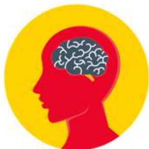
Cultura de ciberseguridad