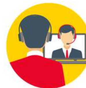
Canales de soporte