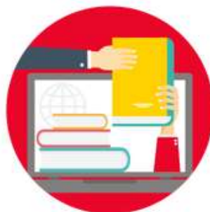
Capacitación y formación