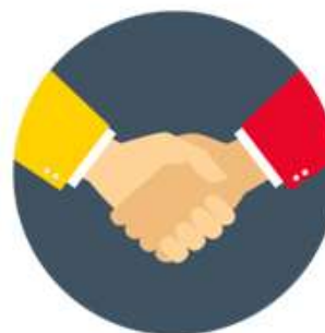
Colaboración con entidades